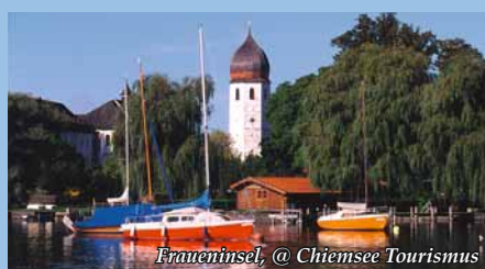
Fraueninsel, @ Chiemsee Tourismus