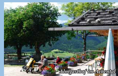
Almgasthof im Adhentäl

alle Preise pro Person im Doppelzimmer Einzelzimmerzuschlag 120,- €