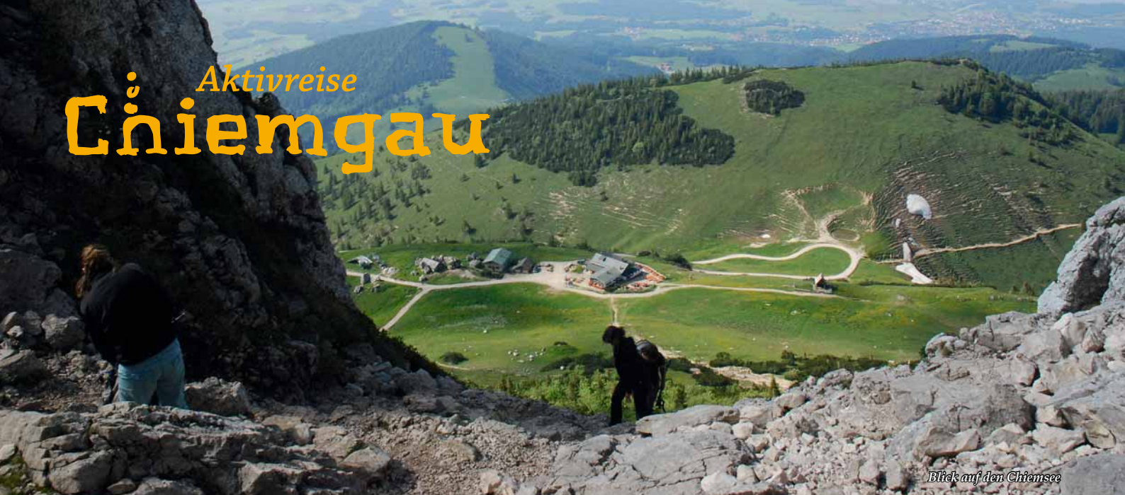
Blick auf den Chiemsee