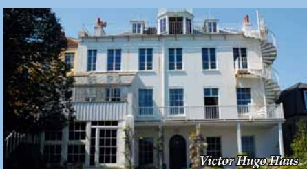
Victor Hugo Haus

alle Preise pro Person im Doppelzimmer Einzelzimmerzuschlag 170,- € (Einzelzimmer sind Doppelzimmer zur Einzelbenutzung)