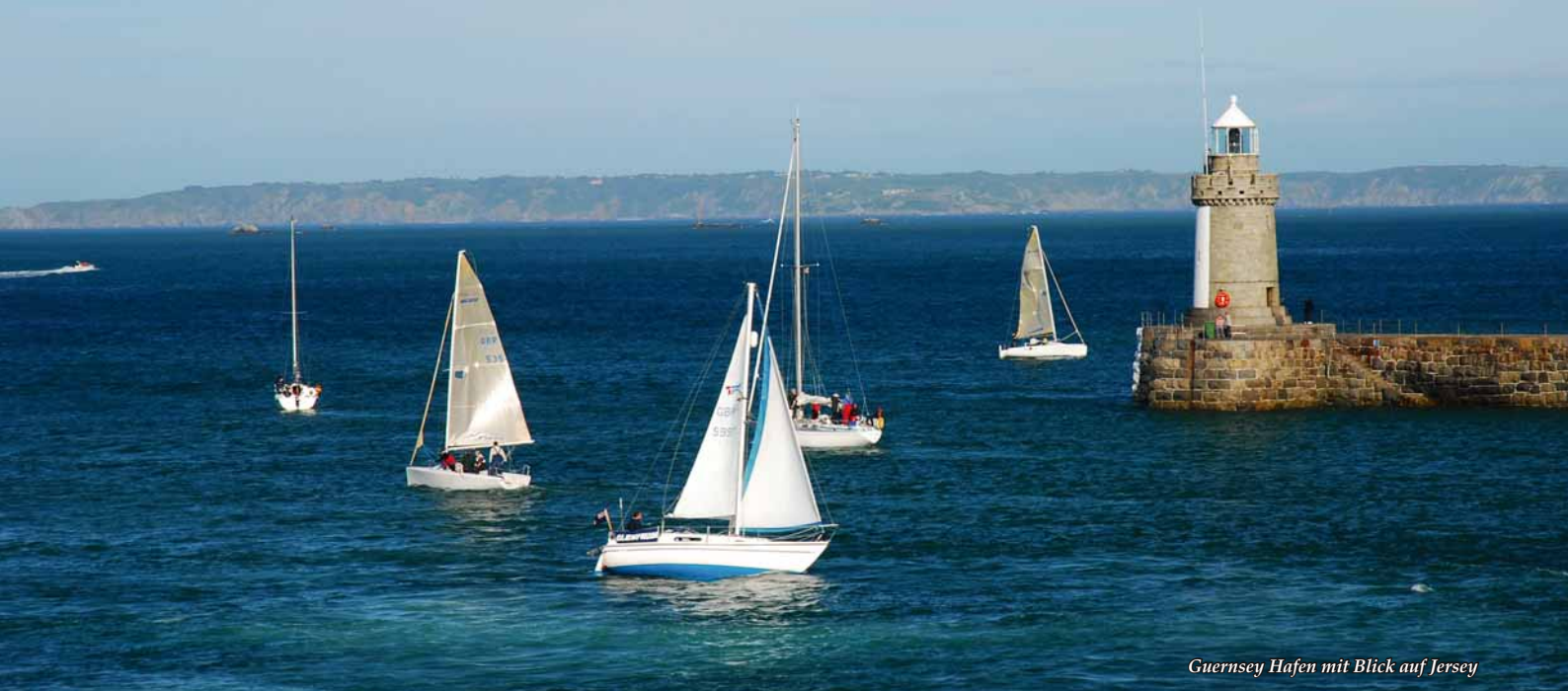
Guernsey Hafen mit Blick auf Jersey

die Rückfahrt zwischen mehreren Fähren wählen und auf eigene Faust zurückfahren, um z.B. das faszinierende Haus Victor Hugos in St Peter Port zu besichtigen.