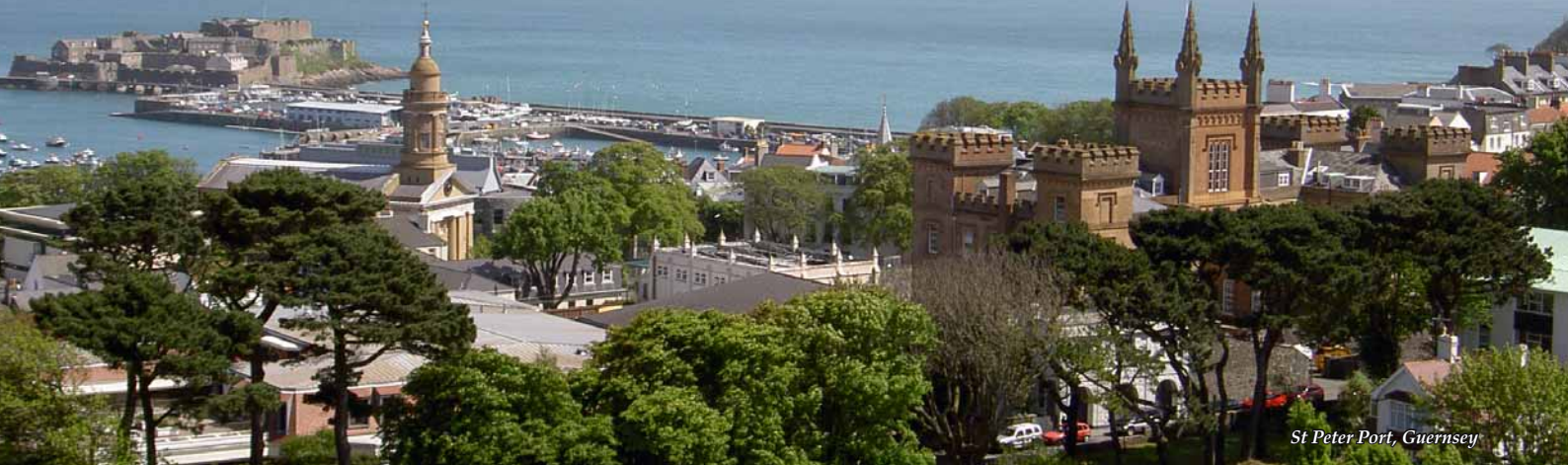
St Peter Port, Guernsey